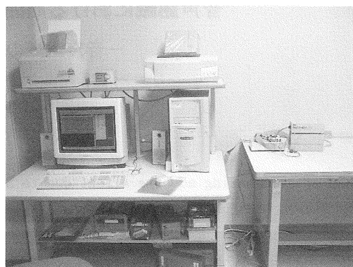
Fig. 2 マイコン開発支援装置