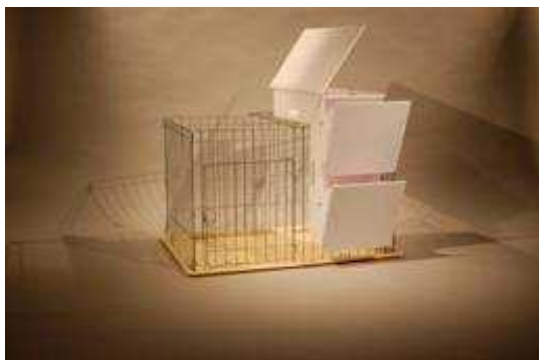
Fig. 4 ペーパーモデルの作成

対象案件は、ペット用品の開発支援（平成24年度グッドデザイン商品創出支援事業）である。ペーパーモデル手法によるプロトタイプの作成による構造や素材の検討と、作成したプロトタイプの操作行為をビデオ撮影して観察、分析することによりユーザー要求事項を把握することを目的として行動観察手法を試行した。