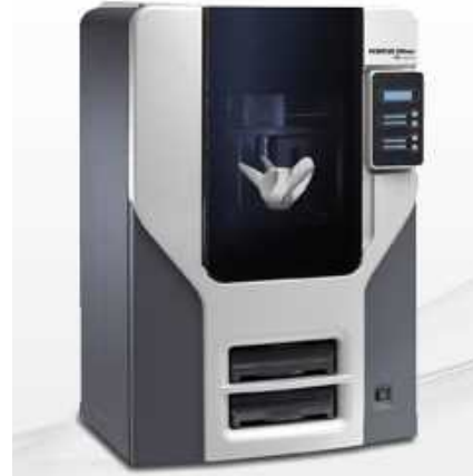
Fig. 3 3Dプリンターの例

3Dプリンターは国内外において様々な製品が開発され、目的・用途に応じて様々な造形方法が提案されている。ラピッドプロトタイピングを初めとした「形状確認」や「機能検証」の用途向けには、ABS樹脂やポリカーボネイトといったエンジニアリングプラスチックに近い性状の原料を熱で溶かして積層する手法や、光硬化させる手法、レーザーの高温で焼結させる手法等が開発され普及が進んでいる。量産製品素材に準ずる強度を発揮する素材を用いて試作することにより、他のパーツと組み合わせて、強度や機構等の機能面を検証すること等が可能となっている。