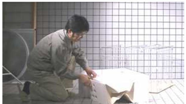
Fig. 5 プロトタイプの操作行為の観察

次に、プロトタイプの操作行為について、HMI（ヒューマンマシンインターフェイス）の観点、操作・行動の手がかり、識別性、操作・行動に対する制約状況等、それぞれの観点に着目して観察することにより、アイデアスケッチや開発会議では認識されていなかったユーザー要求事項を把握することができた。