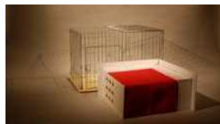
Fig.1 開発各工程の試作モデル