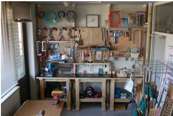
Fig. 2 大分県産業科学技術センターB202 試作室

プロトタイピングにおいては、多くのアイデアの可能性を検討するためにプロトタイプには質より量が求められる。上記の分類の中ではあえて①②レベルの精度をあまり追求しないモデルを積極的に活用するものであり、素材として手工具で効率よく開発者のアイデアを具現化できる、紙、スチレンボード、スタイロフォーム、合成木材等が使われている。当センターにおいても従来からこれらの素材の活用は、商品開発業務の中心として実施してきたところであり、制作環境の整備と作業ノウハウの蓄積は、企業支援に十分なレベルが既に保持できていると思われる。